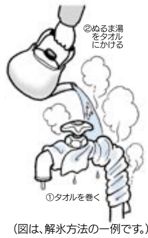
(図は、解水方法の一例です。)